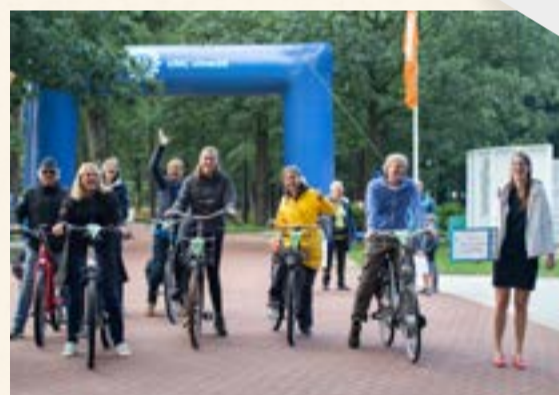
"Nu kom ik weer vooruit"

actievoorumcutrecht.nl/atlantic-dutchesses