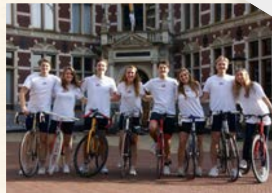
Heart to Handle