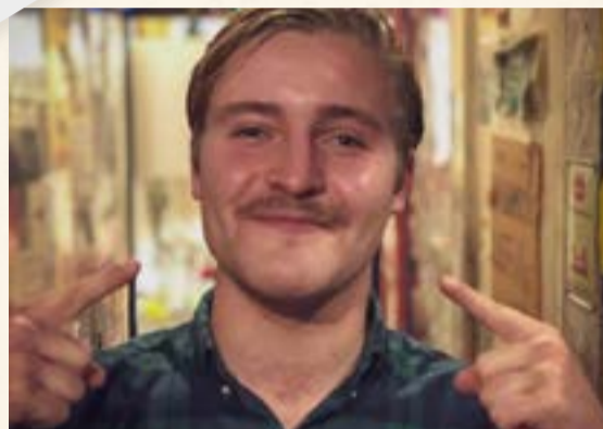
Snor met een missie

Ze zaten nu misschien vaak verscholen achter een mondkapje, maar ze waren er zeker: snorren in allerlei soorten en maten. Want ook dit jaar lieten de mannen van het Utrechtsch Studenten Corps hun snor staan voor prostaatkanker. Tijdens het drukken van deze krant waren de mannen al goed op weg om hun streefbedrag van 10.000 euro te halen.